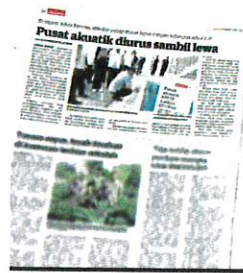
KERATAN Kosmo semalam.

"Walaupun Jabatan Kesihatan Negeri Johor (JKNJ) mengesahkan air kolam itu sudah bebas bakteria e-coli, namun kita tak mahu ambil risiko dan terkejar-kejar untuk membuka