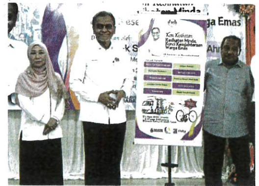
Dr Dzulkefly merasmikan Kem Kesihatan Minda Kunci Kesejahteraan Warga Emas di Jeram Tekoh, Gua Musang, semalam.

Pada 22 Julai lalu, seorang pelajar Tingkatan Empat di Chuak, Terengganu pengsan selepas dipercayai menghisap vape yang perisanya dicampurkan benda asing.